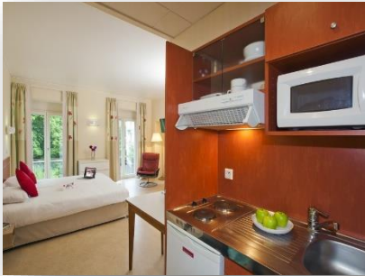
Studio lit double

Ascenseur / Wifi / Parking / Espace verts privatifs / Climatisation / Journaux à disposition / Insonorisation (Double vitrage) / Room service / Blanchisserie etc.