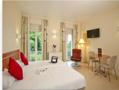
Studio lits jumeaux