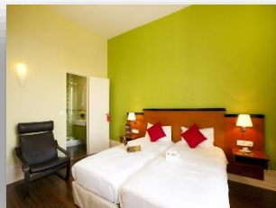
Appartement lits jumeaux