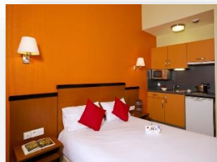
Studio lit double

Ascenseur / Wifi / Parking / Espace verts privatifs / Journaux à disposition / Room service / Blanchisserie etc.