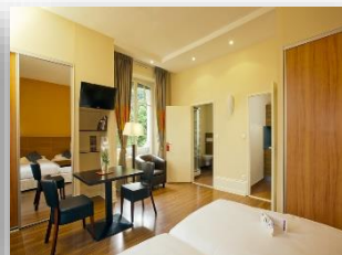
Appartement lits jumeaux avec baignoire