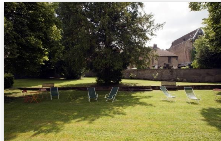
Jardin de la Résidence le Métropole

Profitez de la détente, de la nature et des loisirs au cœur de la résidence le Métropole.