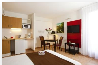
Studio lit double