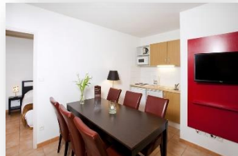
Appartement 6 personnes