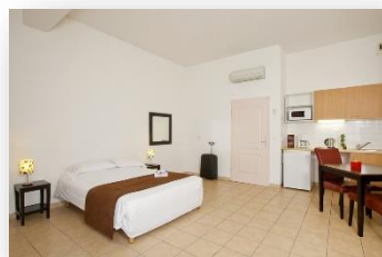
Studio 3 personnes