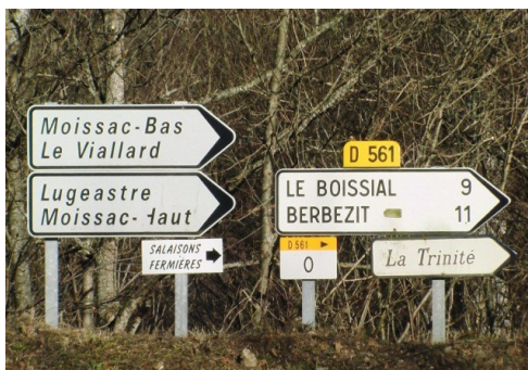
photo ci-dessous, vous traversez un pont). Continuez la route en montant environ 5 kilomètres et à Lugeastre suivez les panneaux:

En venant du nord prenez la sortie 20, Brioude. Suivez la N102 direction Le Puy-en-Velay. Au troisième rond-point, prenez la cinquième sortie direction* La Chaise Dieu. Au rond-point suivant prenez la première sortie direction La Chaise Dieu. Continuez la route et puis prenez la première route à droite direction Fontannes. Suivez les panneaux: Paulhaguet. Environ 2 kilomètres après Frugières-le-Pin prenez à gauche direction Vals le Chastel. Continuez la route jusqu'à Vals le Chastel (D56). Après Vals le Chastel continuez la route direction St. Didier sur Doulon et prenez la première route à droite direction Lugeastre (voyez la