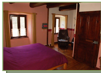
Chambre La Montagne