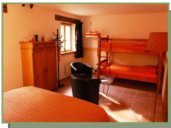
Chambre La Lumière