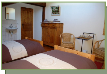
Chambre La Forêt