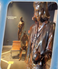
5 L'engagement social Social commitment