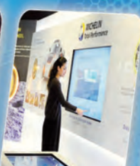
9 Les enjeux de la mobilité de demain Mobility challenges of the future