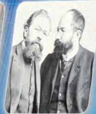
1 Les origines de Michelin The origins of Michelin