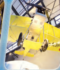
3 Des pionniers de l'aviation Aviation pioneers