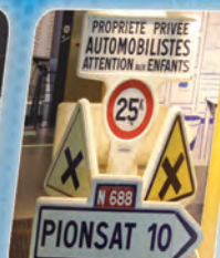
7 Aider et guider le voyageur Helping and guiding travelers