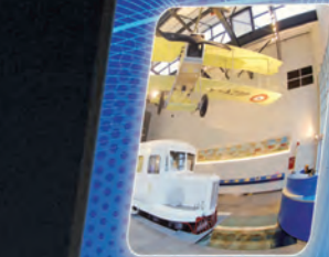
Hall d'accueil Entrance hall

- Race arena (track and game console), - Photo with the Michelin Man, - What do tyre markings mean?