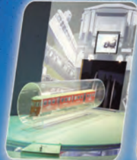
4 La Michelinie : l'innovation sur les rails The Michelinie: innovation on the rails