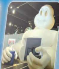
6 Du génie dans la publicité Advertising genius