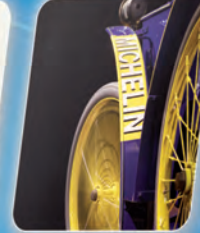
2 Rouler sur de l'air Riding on air