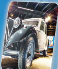
8 La révolution du Radial The Radial revolution