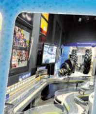
10 Showroom et ludospace Showroom and play area