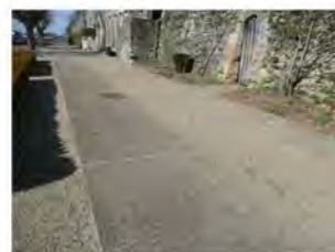
Bande de roulement

De l'accueil vers le restaurant, accessible par une rampe.