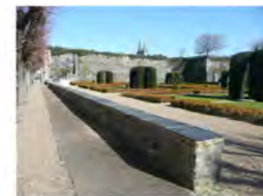
Muret de schiste dans la cour

- Plusieurs zones de repos sont à votre disposition: