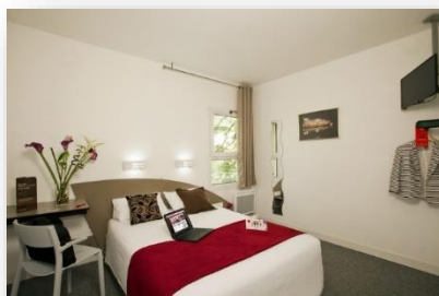
Chambre confort double