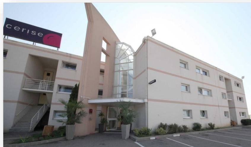
Extérieur CERISE Nancy