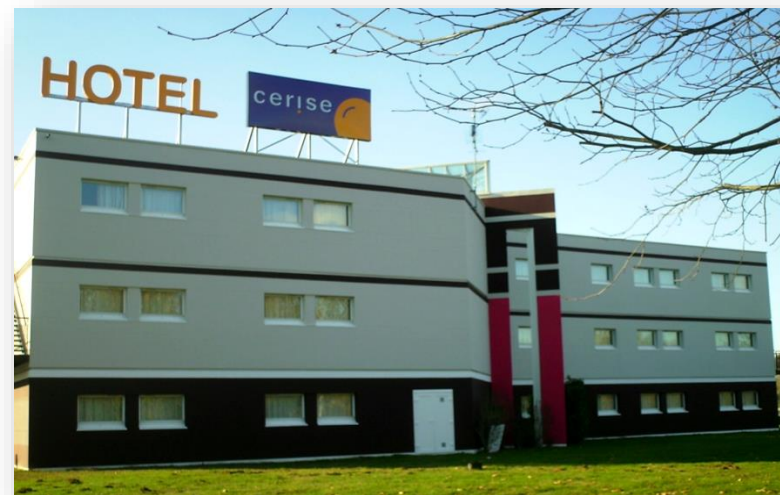
Extérieur CERISE Auxerre

Profitez de la Bourgogne pour vous évader...CERISE Auxerre vous accueille !