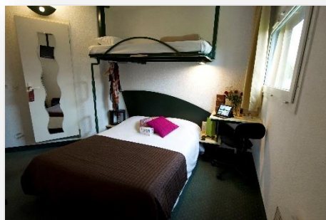
Chambre double ou triple