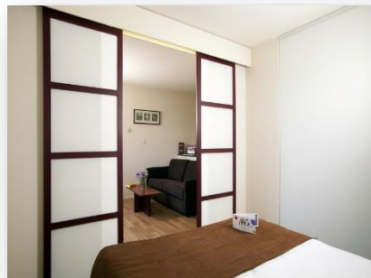
Appartement 4 personnes avec vue piscine