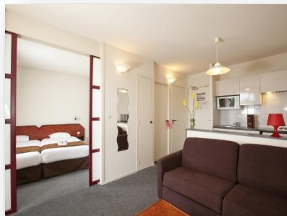
Appartement 4 personnes avec vue forêt

Accès WIFI gratuit / Piscine extérieure / Parking gratuit / Laverie / etc.