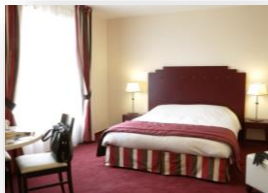
Chambre lit double

Accès Wifi gratuit / Parking privé / Laverie / Consignes à bagages / etc.