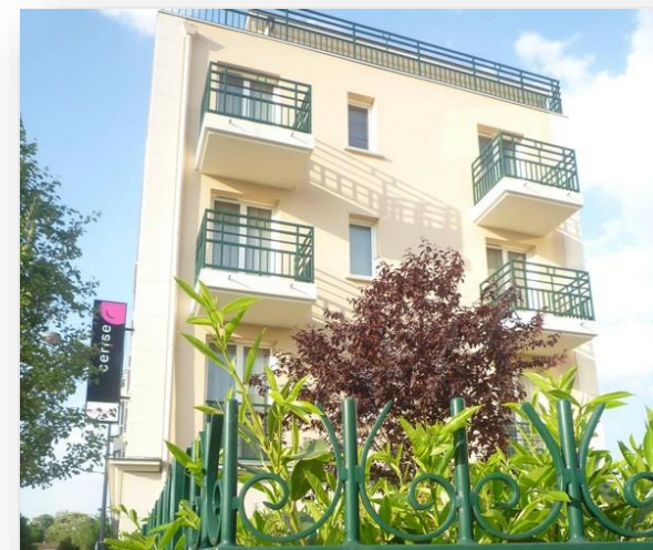
Extérieur CERISE Chatou