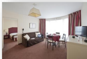
Appartement 4 personnes