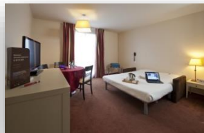
Studio lit double