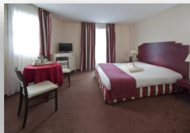
Studio confort lit double