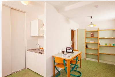
Studio 3 personnes