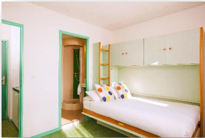
Studio 2 personnes

WIFI gratuit / Parking extérieur gratuit et parking intérieur payant / Laverie / 3 salles de séminaires / etc.