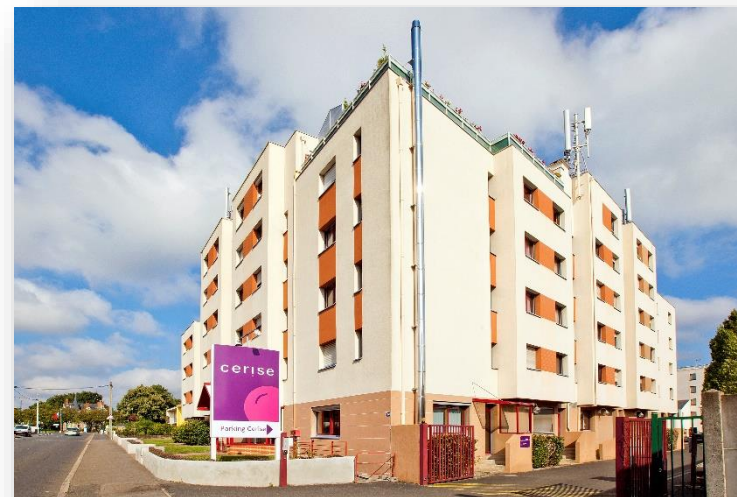
Studio CERISE Nantes la Beaujoire

Profitez de la détente, de la nature et des loisirs au cœur de la résidence CERISE Nantes La Beaujoire.