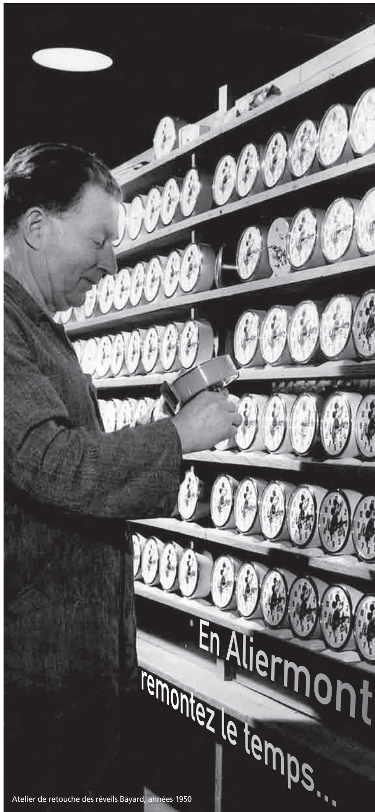
Atelier de retouche des réveils Bayard, années 1950