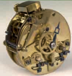
Mouvement de Paris, XIX e siècle