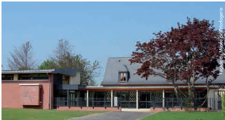
Facade du Musée de l'Horlogerie