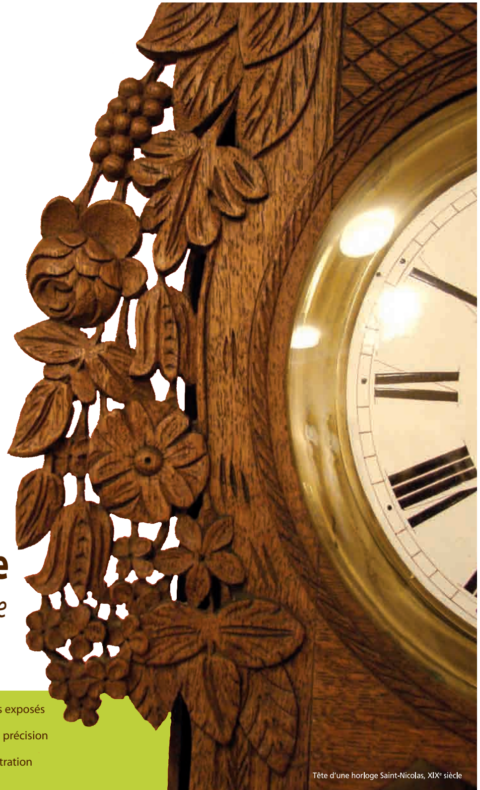
Tête d'une horloge Saint-Nicolas, XIX e siècle