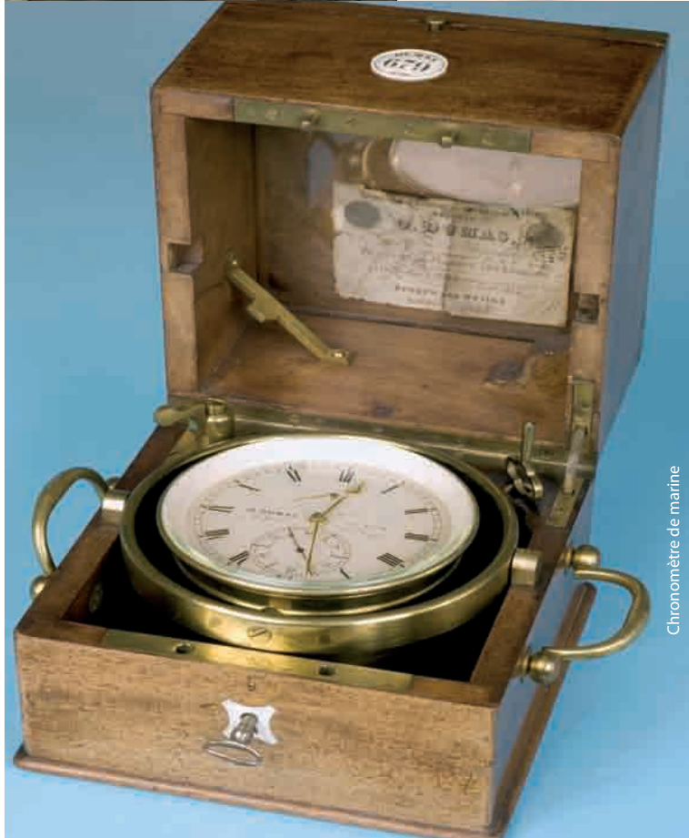
Chronomètre de marine

Haut lieu de l'histoire industrielle de la région, Saint-Nicolas d'Aliermont vous accueille dans un espace de plus de 350 m 2 pour une visite du nouveau musée de l'horlogerie.