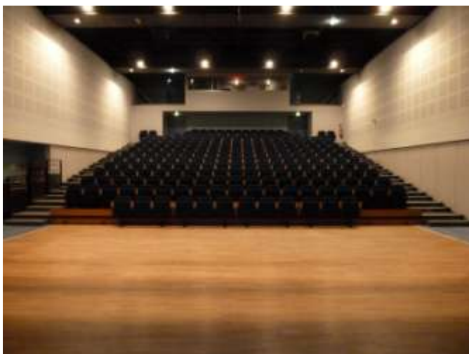
Vue du bas