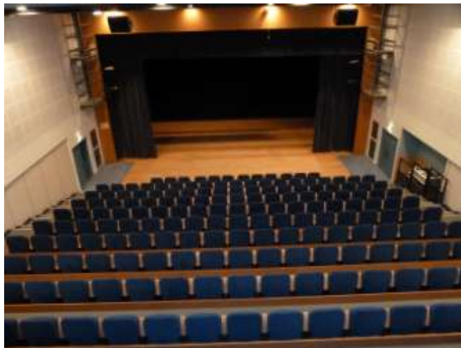
Vue du haut