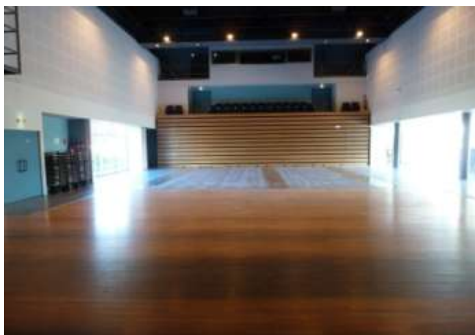
Vue du bas