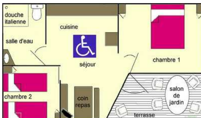
plan d'un chalet PMR (adapté aux Personnes à Mobilité Réduite), 4/5 pers. max., 8,40 x 5 m. Deux chambres dont une très grande, salle d'eau avec douche italienne.