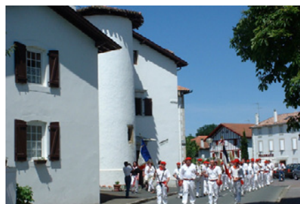
Urt, le centre du village

Tous commerces et services médicaux Tennis - Fronton - Fleuve et rivière Itinéraires pédestres et cyclistes