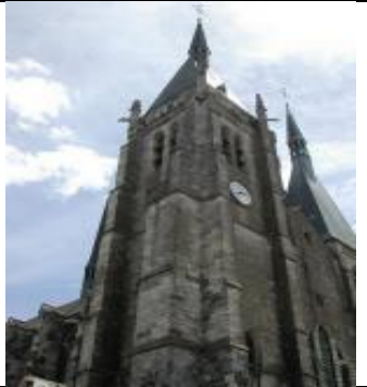
L'église Saint Germain l'Auxerrois

L'église a été construite un peu avant le château fort.