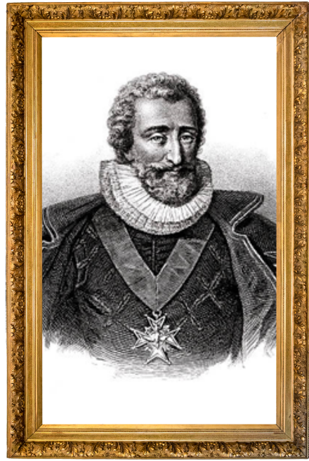
Le roi Henri IV

Le Duc de Lesdiguières était un chef militaire français.