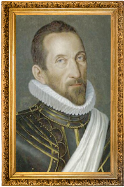
Le Duc de Lesdiguières