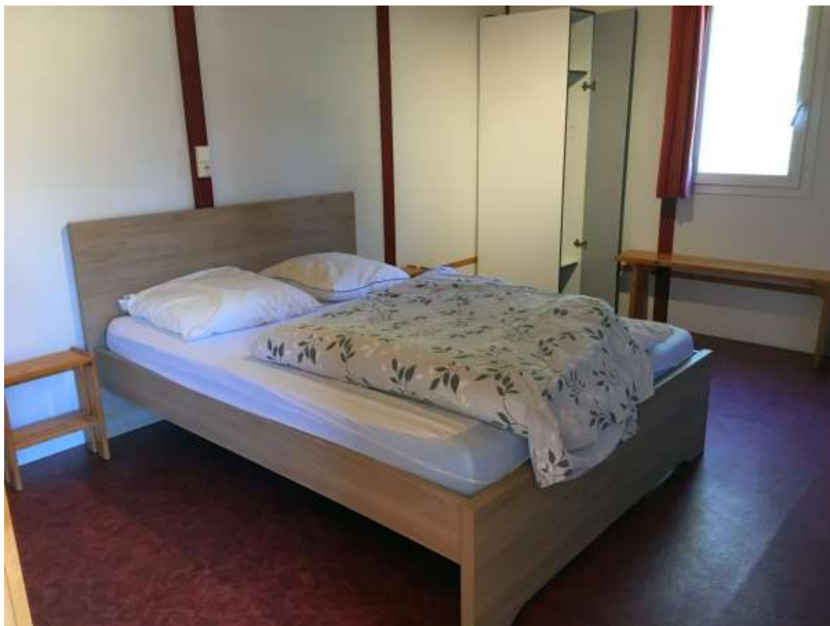
Vues de la chambre accessible à une personne en fauteuil roulant ; un lit simple peut y être ajouté.