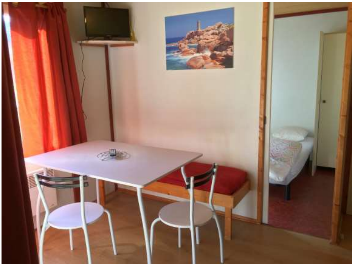
Vues du séjour ;