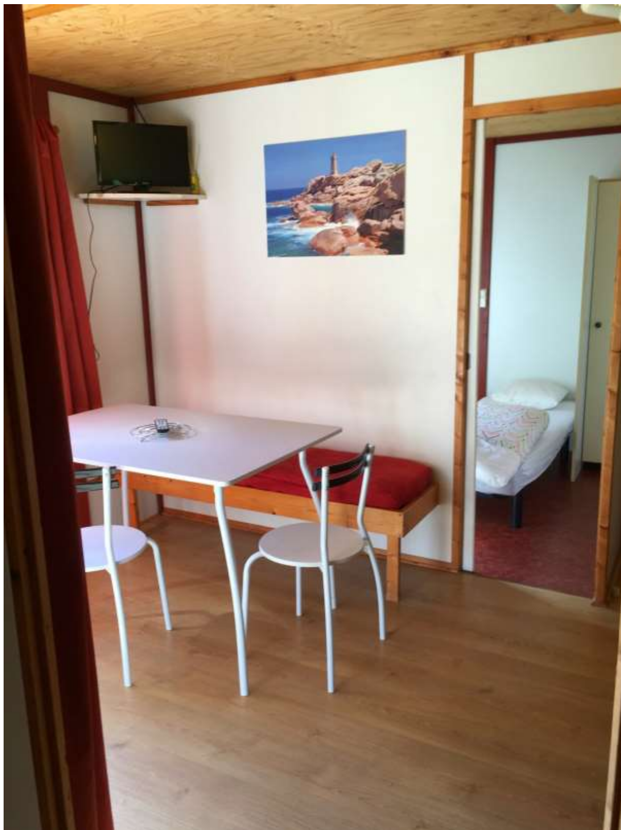
Le coin repas derrière lequel on aperçoit la chambre "enfants" ou "accompagnateurs" (deux lits simples). Cette 2 e chambre n'est pas accessible en fauteuil roulant.