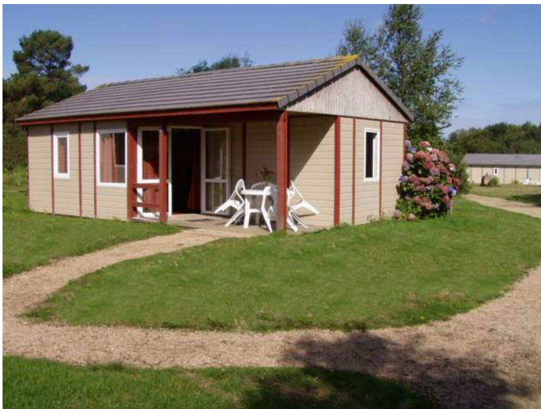
Vue générale d'un chalet adapté aux personnes handicapées.