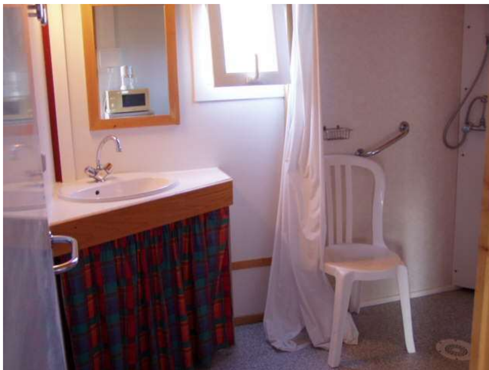
La salle d'eau : lavabo, douche italienne, barres de soutien, toilettes rehaussés.