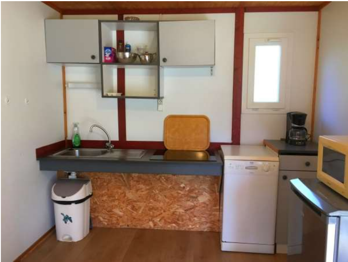
La cuisine comprend les équipements (réfrigérateur, micro-ondes/grill, plaques électriques, lave-vaisselle) et tous les ustensiles nécessaires (poêle, casseroles, vaisselle, etc.).