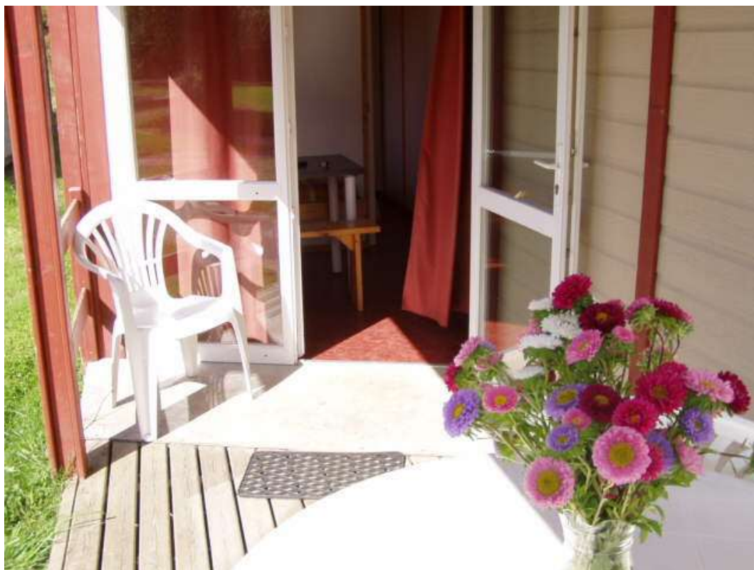
Vues extérieure et intérieure de l'accès au chalet.